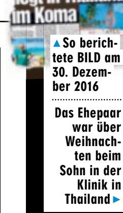
So berichtete BILD am 30. Dezember 2016 Das Ehepaar war über Weihnachten beim Sohn in der Klinik in Thailand

ihr Mann, der als Tischler arbeitet, sind ratlos: „Für die erste Klinik-Rate sind unsere Ersparnisse draufgegangen.“ Jeder Tag in der Klinik schlägt mit 180 Euro zu Buche. Die Mutter gibt die Hoffnung nicht auf: „Wir sind eine große Familie, alle helfen. Meine Schwester hat ein Sammelkonto im Internet eingerichtet. Wir beten, dass wir das Geld zusammenbekommen.“